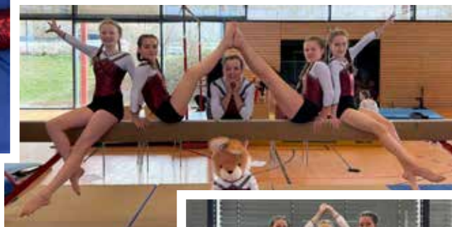
Tuju AK 12/13 Platz 4