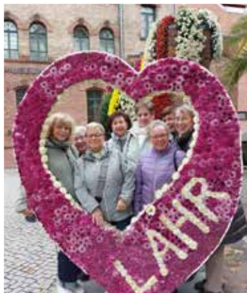
Ausflug Lahr (Chrysanthemen-Ausstellung)