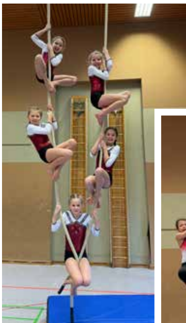
Eichendorffschule 1. Platz Mädchen 3. Platz Jungen