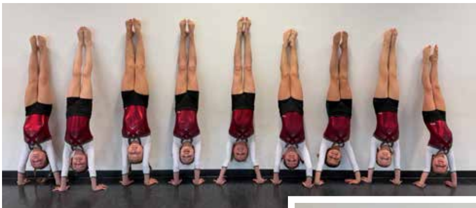
Eichendorffschule 1. und 2. Mannschaft