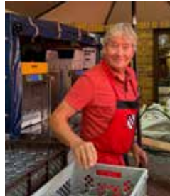
Spüler 2. Schicht