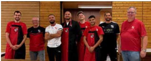
Getränke 3. Schicht