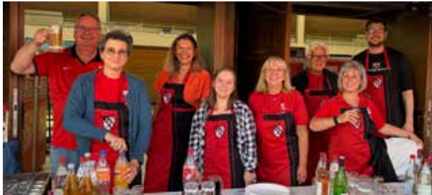
Getränke 1. Schicht