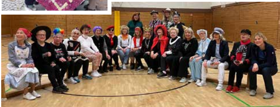
Weiberfastnacht " Helau und Alaaf "