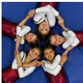
Tuju AK 10/11 Platz 4

Mittendrin: Der Turnerbund, der mit 25 Turnerinnen in fünf Mannschaften vertreten war. Unsere Teams zeigten in den verschiedenen Altersklassen (AK) tolle Übungen und wurden mit hervorragenden Platzierungen belohnt.