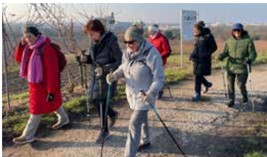
Fröhliches Wandern in Feld und Wald