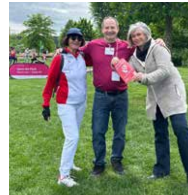
Auftakt Sport im Park "alla Hopp -Park " Kirchheim

"Rücken Fit" "Fit for ever" "Body Forming" "Fit und Beweglich in jedem Alter" "Aerobic" "Yoga" "Wandern"