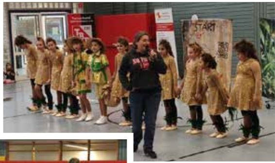
Carneval Club „Blau Weiss“