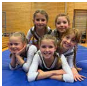
Tuju AK 10/11 Platz 2