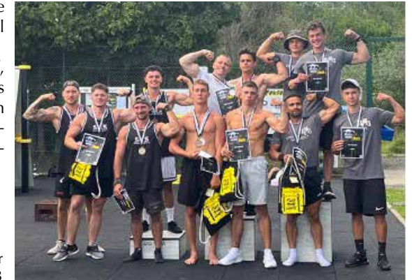
Gruppenbild der Teilnehmer von Platz 1-3

Trotz großer Anstrengungen musste das Team jedoch knapp die Segel streichen und wurde Zweiter. Es war ein spannender Wettkampf, bei dem alle Teilnehmer aus den unterschiedlichen Regionen Deutschlands die gleichen Disziplinen in einer begrenzten Zeit absolvieren mussten.