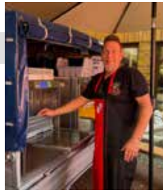
Spüler 1. Schicht

Nach dem traditionellen und „unfallfreien“ Fassbier-Anstich und den Salutschüssen der Rohrbacher Schützen spielte die Kircheimer Band Off Limits vor einem zahlreichen und ausgelassenen Publikum.