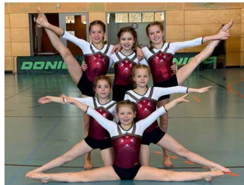
Eichendorffschule 3. Platz