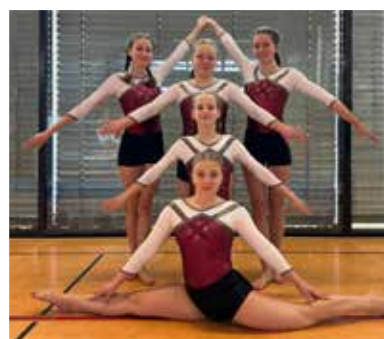
Tuju jahrgangsoffen Platz 4

Wir freuen uns über die geschlossene Mannschaftsleistung und gratulieren allen Turnerinnen sowie dem Trainerteam herzlich!