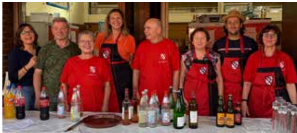
Getränke 2. Schicht