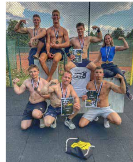
Sieger der Herzen

Das Team ist jedoch nicht enttäuscht und blickt bereits nach vorne. "Nächstes Jahr holen wir uns den Sieg zurück", lautet das Motto. Mit noch mehr Training und Erfahrung ist das Team bereit, den Titel zurückzuerobern. Wir gratulieren dem Heidelbarz-Team zu seiner starken Leistung und wünschen ihnen viel Erfolg für die kommenden Wettkämpfe 2026!